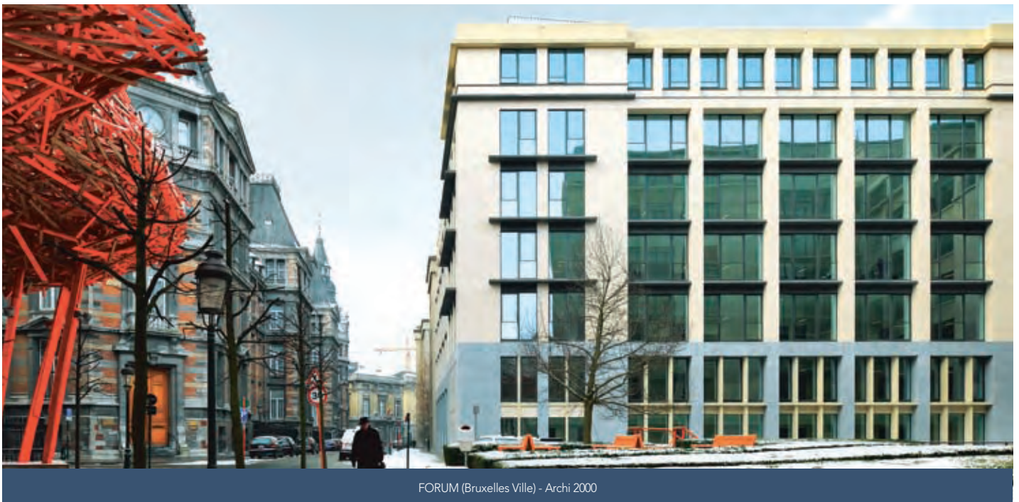
FORUM (Bruxelles Ville) - Archi 2000